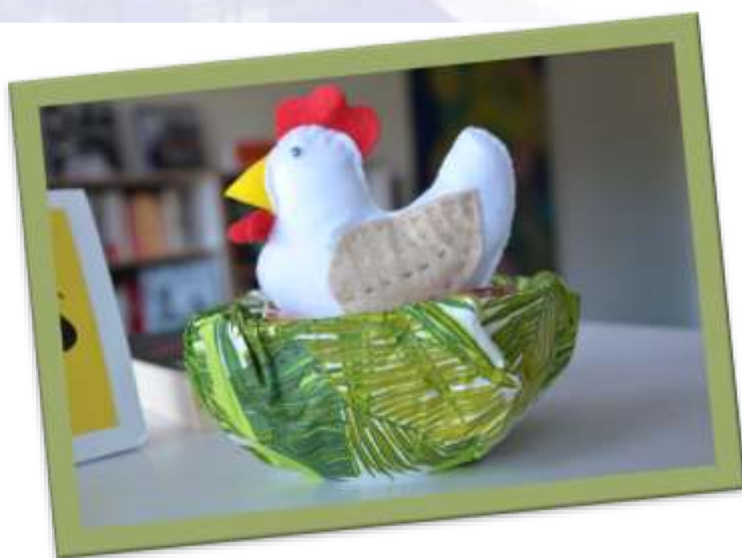
« Pâques »

N'hésitez pas à venir pousser les portes de la bibliothèque, tous les mercredis de 15h à 17h, pour venir rencontrer notre équipe de bénévoles !