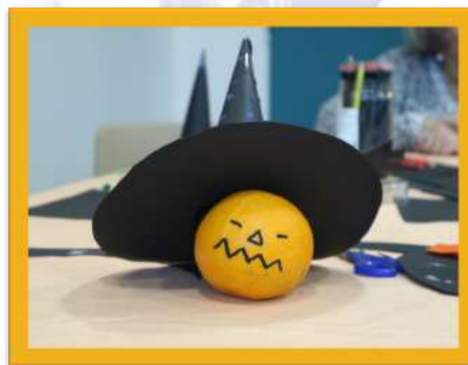
« Halloween »