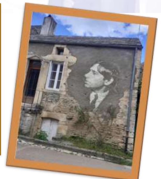
« Dans les pas de Soutine »